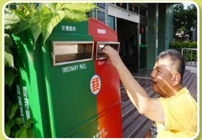
媽媽我愛您~寄送母親節卡片