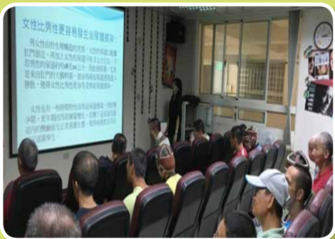
衛生教育講座-泌尿道感染