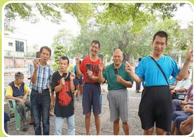
秋高氣爽烤肉活動