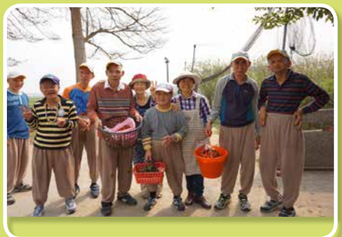
四季採果樂-小蕃茄