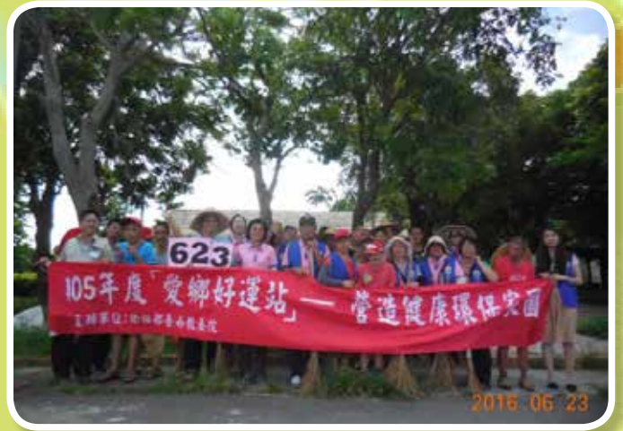
本院志工隊、服務對象、替代役男社區環保清潔活動