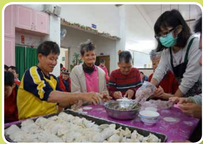
手忙餃亂包水餃活動