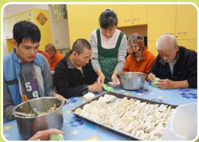
手忙餃亂包水餃活動