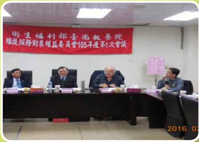
105年維護服務對象權益委員會