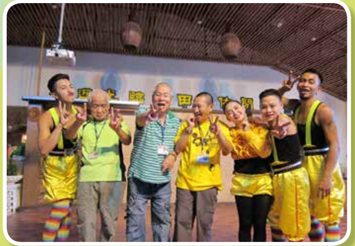
松田崗親子聯誼活動