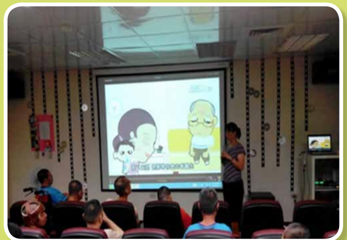
衛生教育講座-吃出健康吃出營養