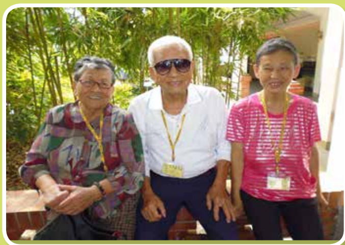
親子活動-歡樂共遊