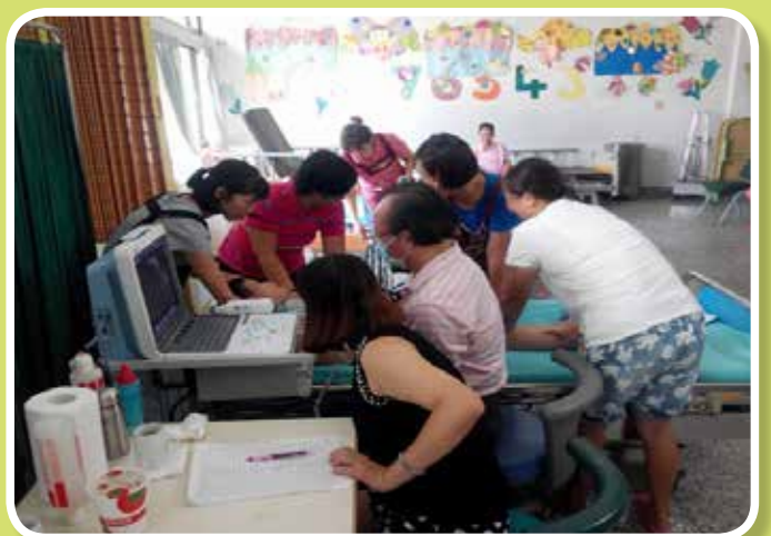
B、C肝服務對象腹部超音波追蹤檢查