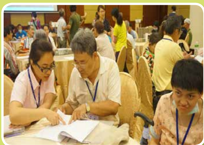
親子活動-分組討論