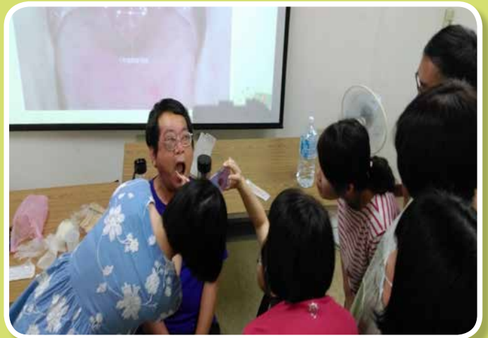
吞嚥障礙冰酸刺激