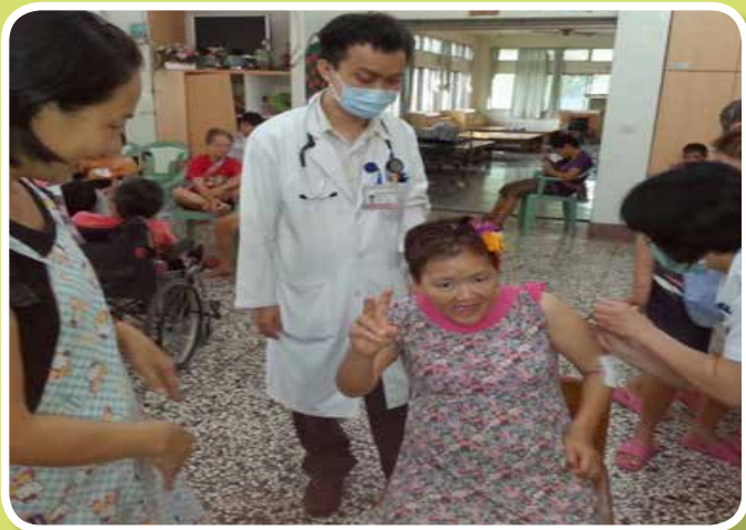
衛生福利部新營醫院醫護人員至院為服務對象施打流感疫苗