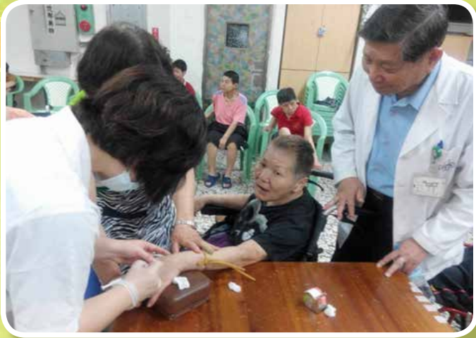
身體健康抽血檢查