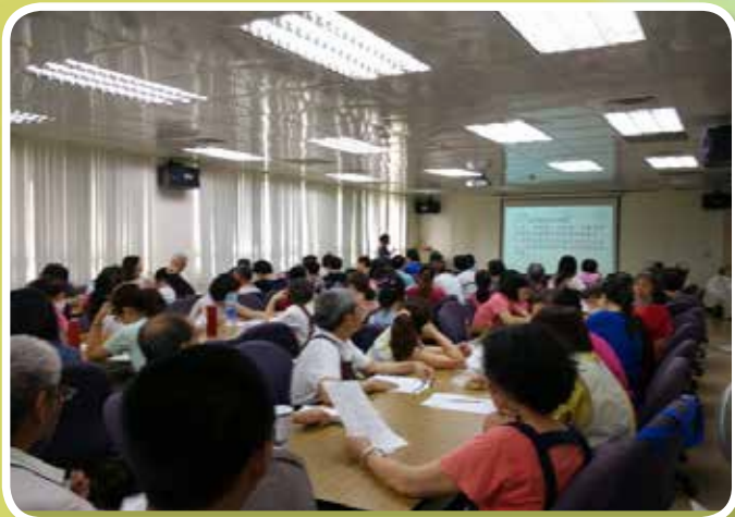
講授「心肺復甦及呼吸道異物梗塞處理」