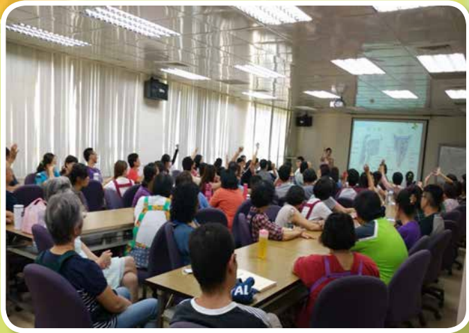
講授「淺談吞嚥障礙及食不下嚥-吞嚥訓練技巧」