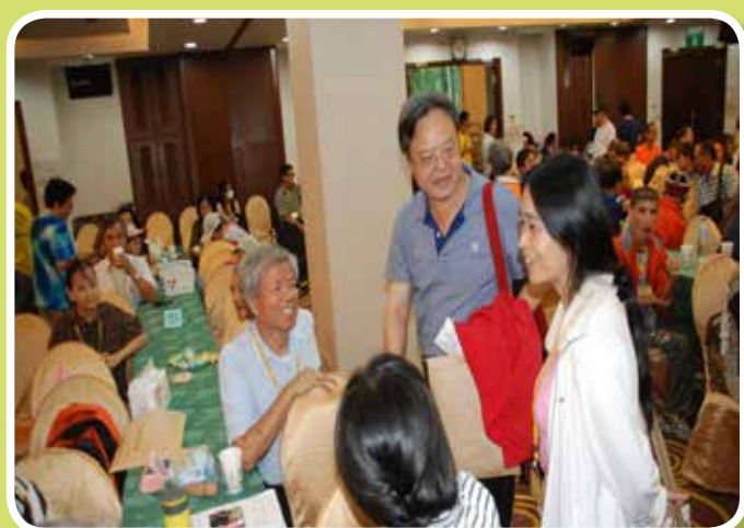
親子活動-分組討論