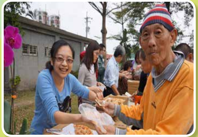
四季採果樂-披薩兌換