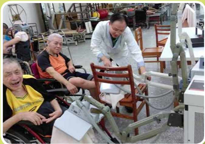
物理治療師為服務對象執行各項復健保健