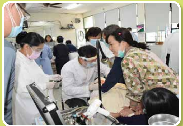
慈濟牙科蒞院提供牙齒保健義診服務