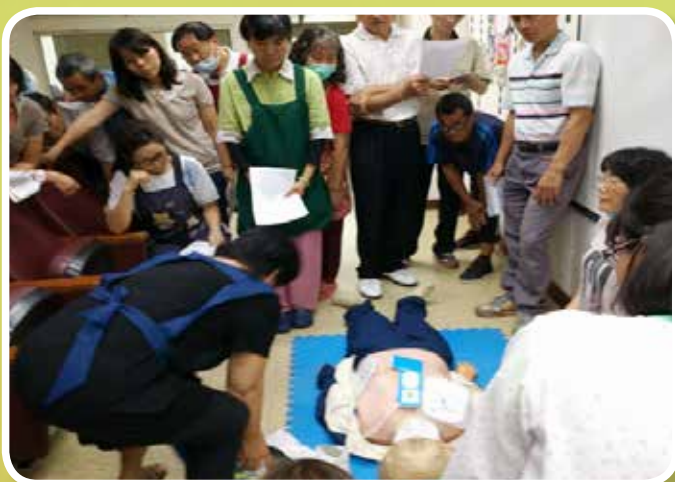
新營醫院醫護人員擔任心肺復甦術技術指導