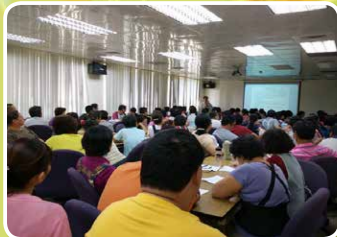
講授「心肺復甦及呼吸道異物梗塞處理」