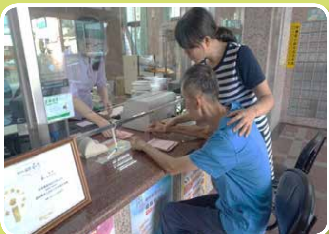
社區漫步-菁寮郵局