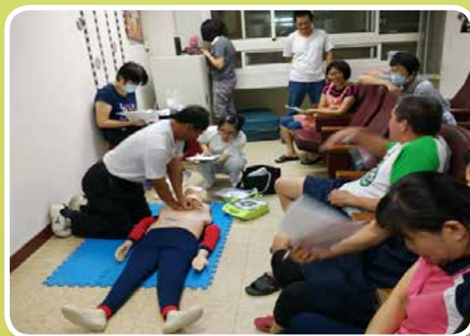
新營醫院醫護人員擔任心肺復甦術技術指導