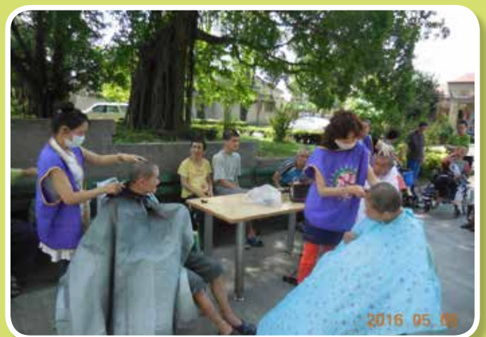
結合民間理髮工會蒞院實施義剪服務