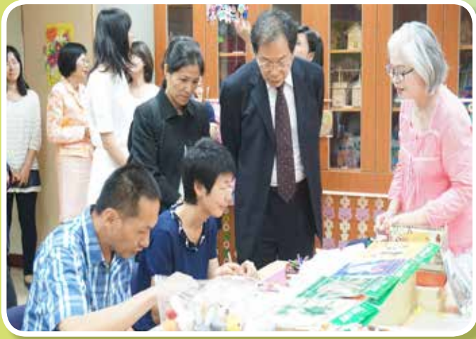
衛生福利部蔣部長丙煌蒞院指導