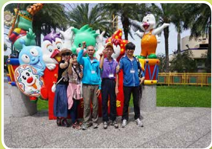
親子活動-歡樂共遊