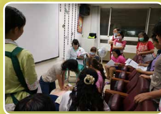
本院員工進行心肺復甦術演練考核情形