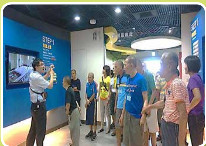
蛋品觀光工廠-聆聽解說