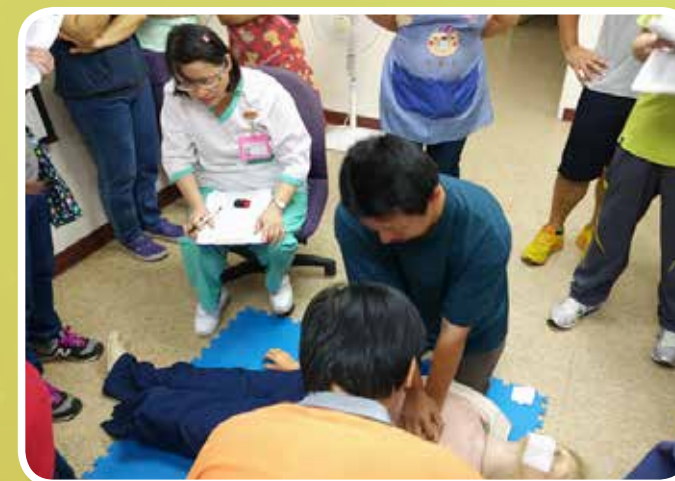
本院員工進行心肺復甦術演練考核情形