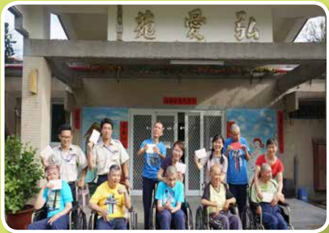
媽媽我愛您~寄送母親節卡片