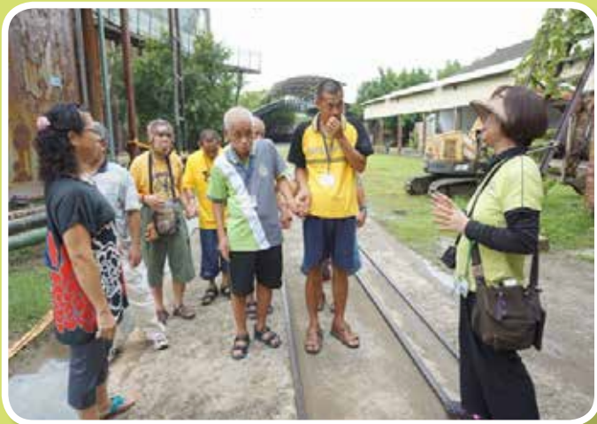
十鼓文創園區-聆聽解說