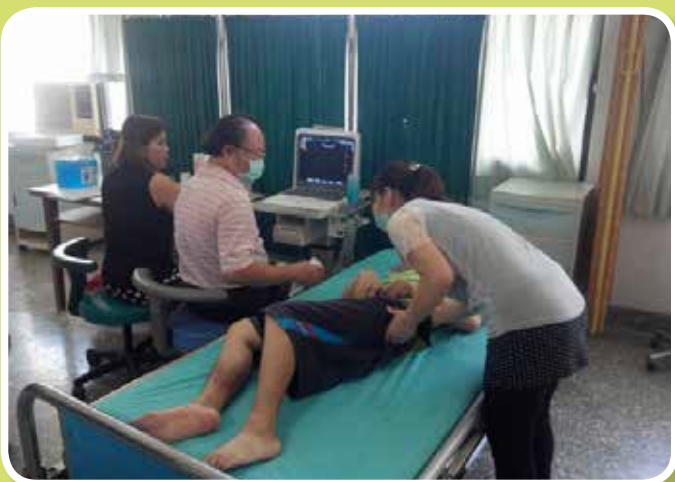
B、C肝服務對象腹部超音波追蹤檢查