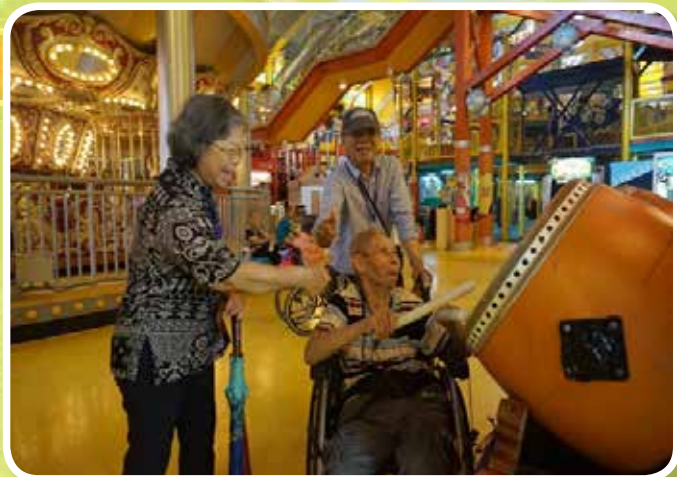
親子活動-歡樂共遊