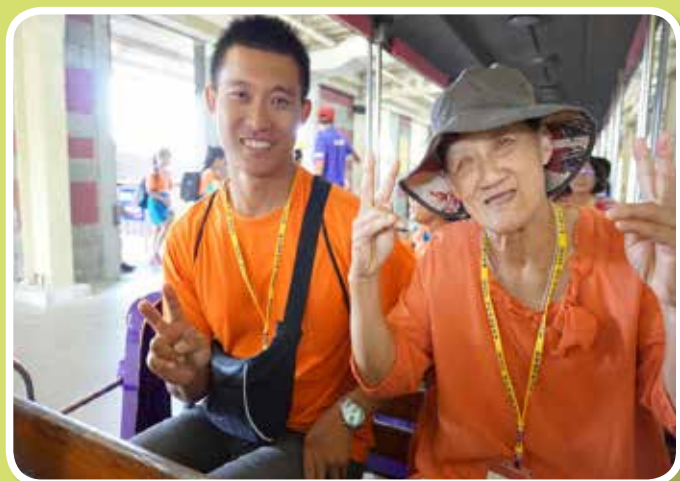
親子活動-歡樂共遊