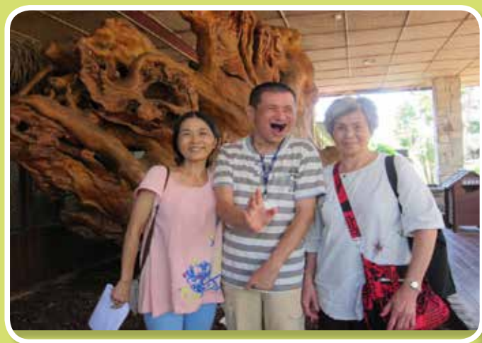
松田崗親子聯誼活動