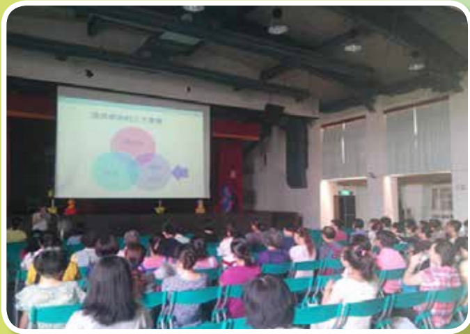
衛生教育講座-長期照護機構感染控制執行策略