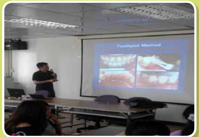
講授「身心障礙者口腔照護」