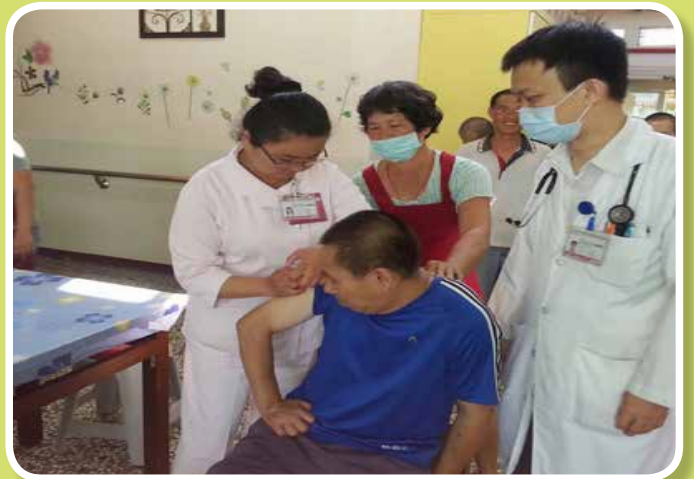
衛生福利部新營醫院醫護人員至院為服務對象施打流感疫苗