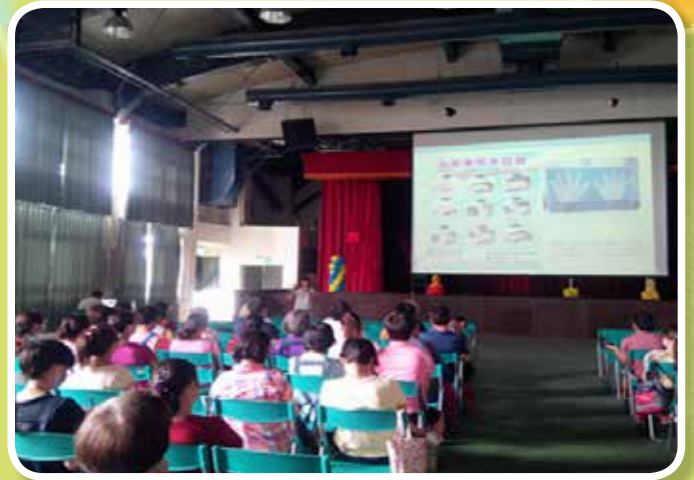
衛生教育講座-長期照護機構感染控制執行策略