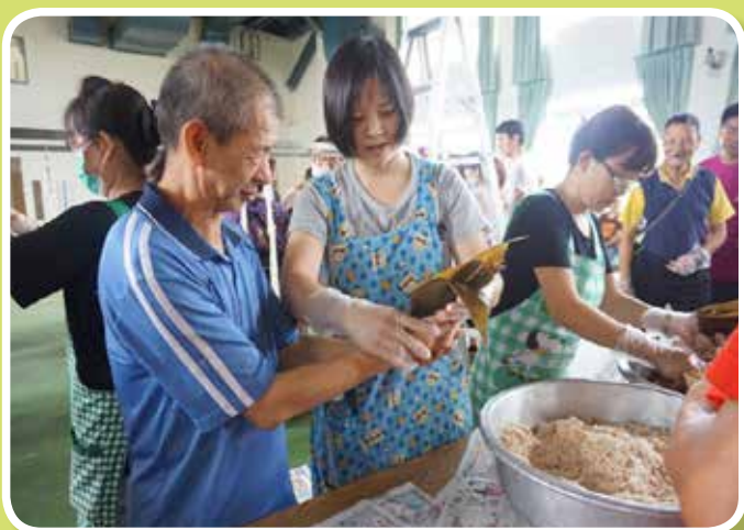
夏日粽情-包粽子活動