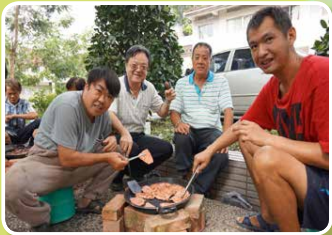
秋高氣爽烤肉活動