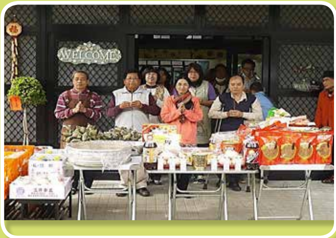
信愛苑歡喜入厝拜平安