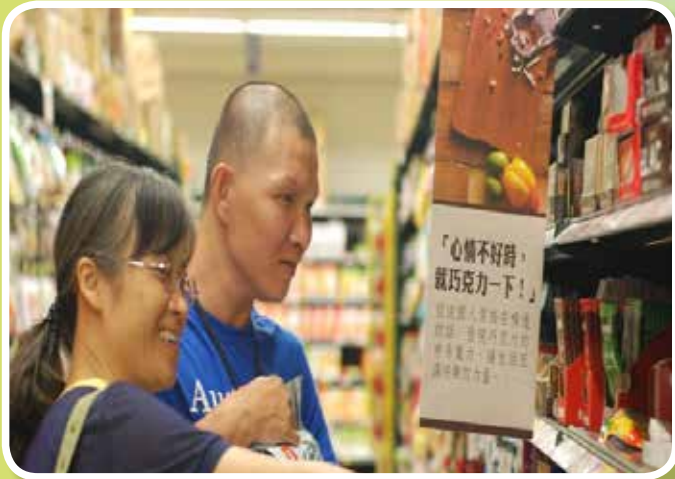
嘉義家樂福-購物訓練