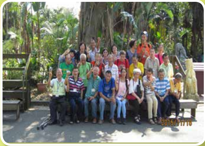
松田崗親子聯誼活動