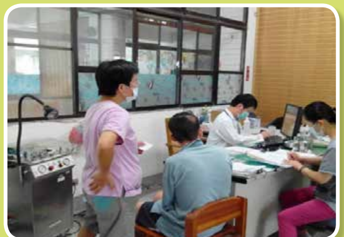
專業醫師蒞院看診-家醫科