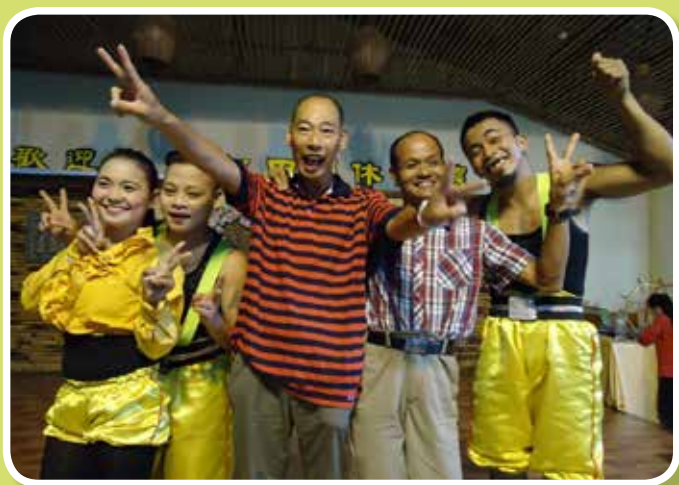
松田崗親子聯誼活動