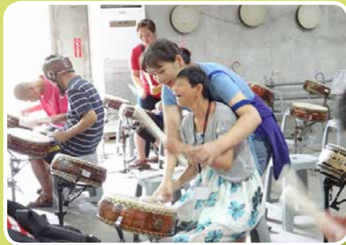
十鼓文創園區-打鼓樂