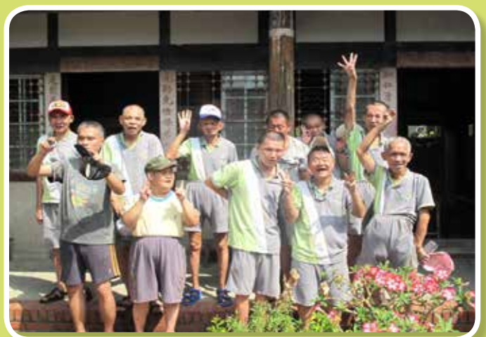
社區漫步-墨林文物館