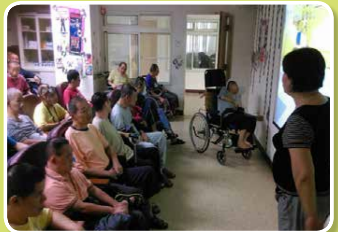
衛生教育講座-我是好主人