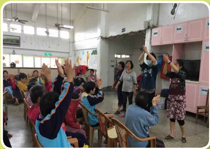
衛生教育講座-手部衛生-洗手演練