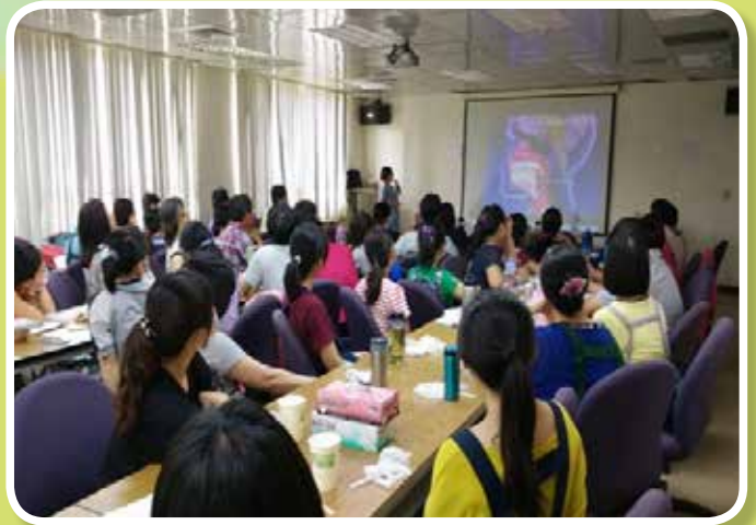
講授「淺談吞嚥障礙及食不下嚥-吞嚥訓練技巧」