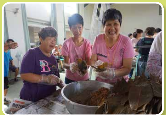
夏日粽情-包粽子活動