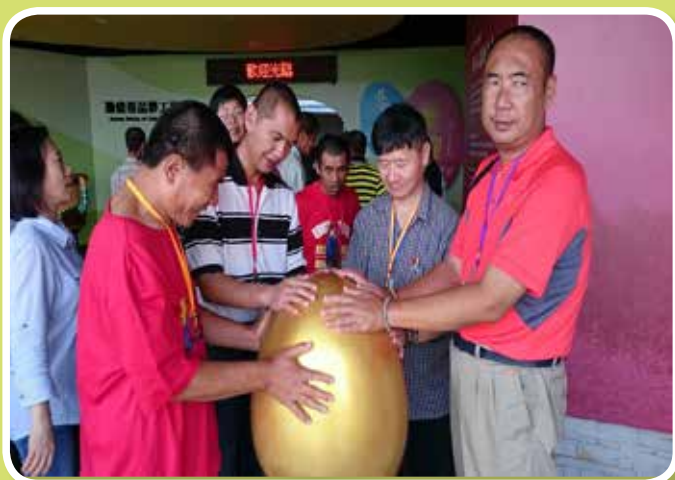
蛋品觀光工廠-參觀體驗