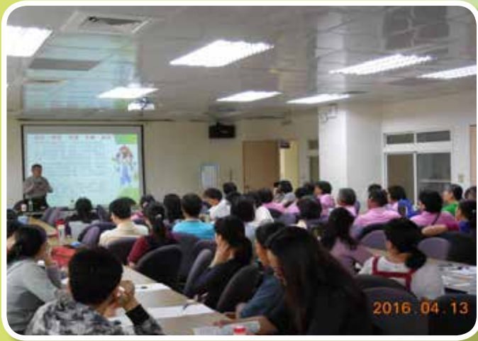
助人歷程與資源運用技巧研習