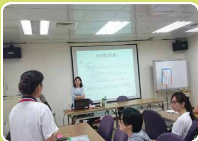
成年監護制度介紹與運用研習