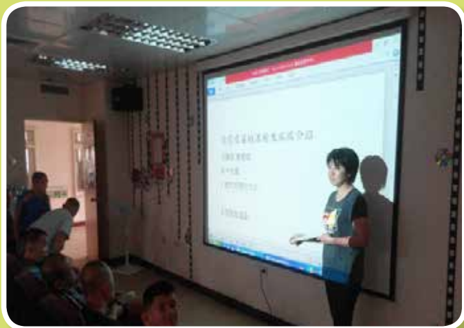
衛生教育講座-流感知多少及預防勝於治療-疫苗注射