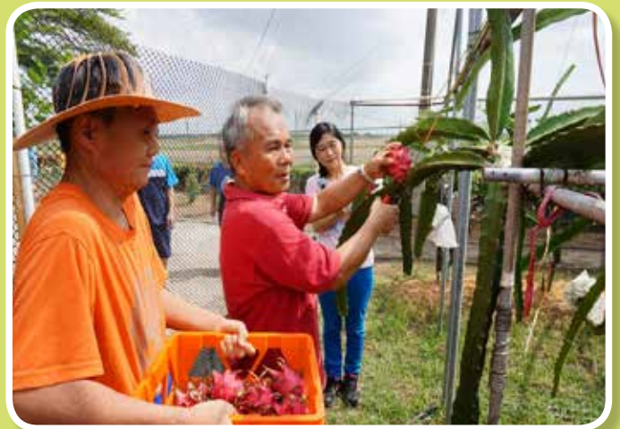
四季採果樂-火龍果