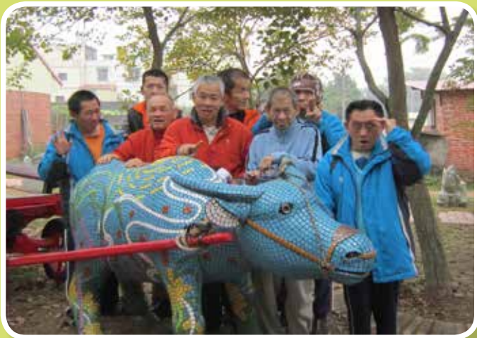
社區漫步-幸福花園