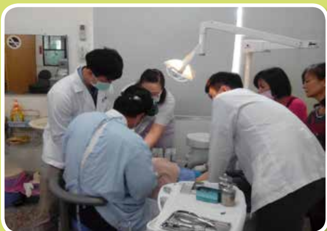
專業醫師蒞院看診-牙科