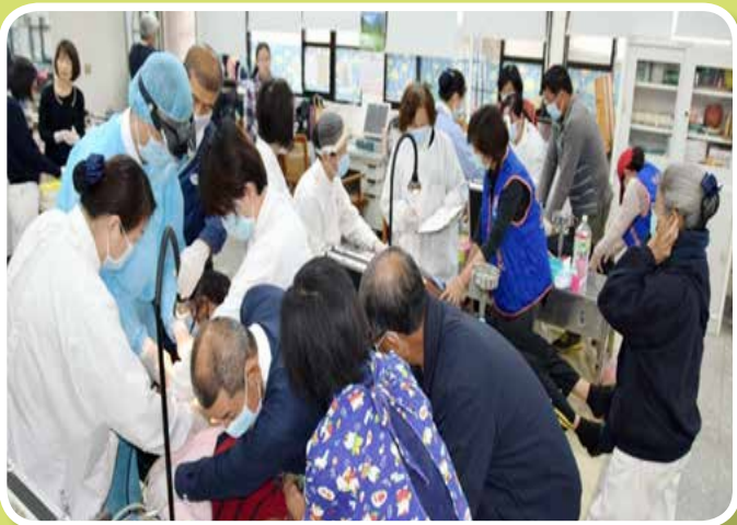
慈濟牙科蒞院提供牙齒保健義診服務